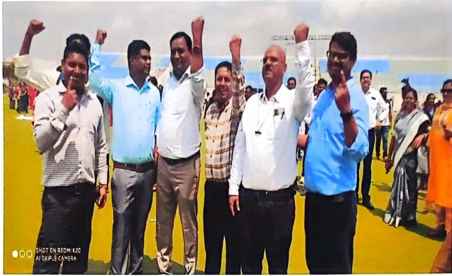
मतदाता जागरुकता कार्यक्रम में सहभागिता